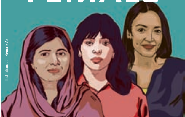
Illustration: Jan Hendrik Ax